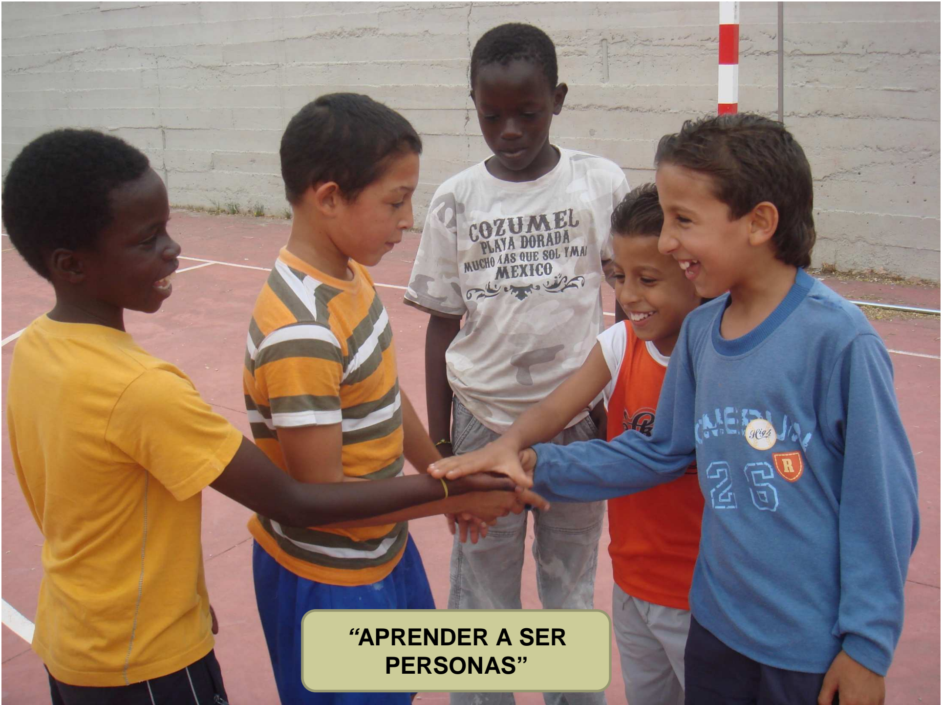
“APRENDER A SER PERSONAS”